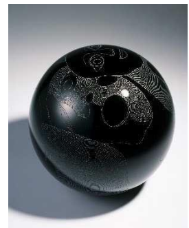
Paolo Martinuzzi Sphère

Après la découverte de la collection sur le thème du corps, de ses représentations et des émotions qu'il transmet, les participants se rendent à la Fabrique pour un moment de création. Inspirés de l'œuvre de Martinuzzi, ils dessinent des personnages aux expressions multiples.